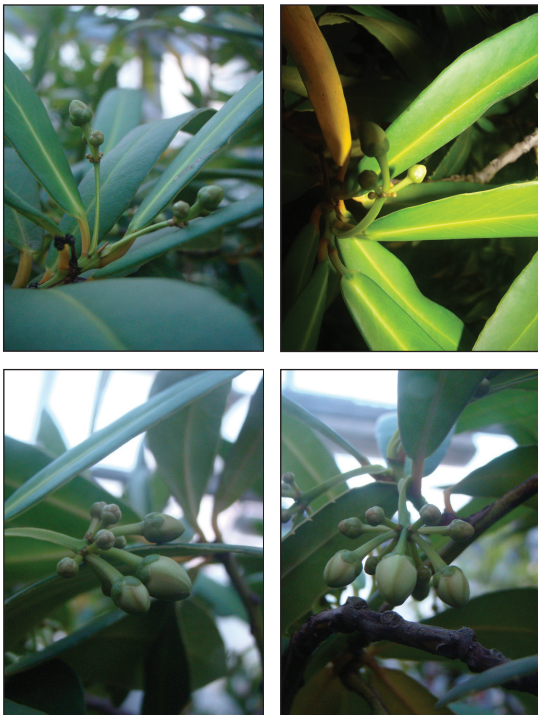
Рис. 2. Некоторые этапы морфогенеза соцветия Brexia madagascariensis .